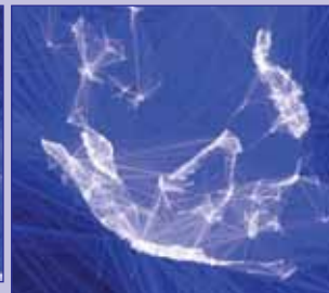
Malajzi, Indonezi, Filipine