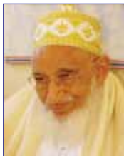
Dr. Syedna Mohammed Burhanuddin, një drejtues Daudi Bohras

Në të gjithë botën Myslimanët Daudi Bohras numërojnë rreth një million. Ata banojnë në Indi, Pakistan, në Lindjen e Mesme, në Afrikën Lindore, dhe në Indinë Perëndimore në shtetin Gujarat. Në Indi Daudi Bohras njihen nga veshjet e tyre: burrat kanë mjekra dhe kësupla të bardha e të arta, me kurta të bardha të gjata, gratë veshin burkas me dy pjesë të qëndisura dhe me ngjyra.