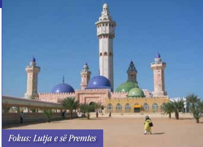
Fokus: Lutja e së Premtes

► Drejtuesit Mouridë janë drejtuesit shpirtërore të 3 deri 5 milionë njerëzve dhe drejtuesit kryesorë të Toubës, qytetit Senegal i dyti nga madhësia (Popullsia 0.5 deri 1.5 milion). Lutu për drejtuesit Mouridë dhe ndjekësit të takojnë Perëndinë e gjallë. Barrierat ekonomike dhe sociale janë domethënëse (mund të luteni bazuar në Vep 13:4-12).