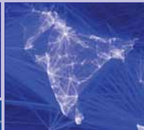
Pakistan, Indi, Bangladesh