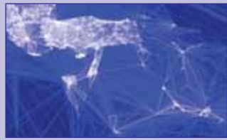
Lindja e mesme