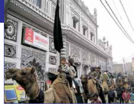
Festivali Muharam në një zonë aty pranë.

Gjuhët kryesore që fliten në Balrampur janë dialektet rustike të Hinduishtes, të njohura si Dehati dhe Urduja. Mbi 40% e Distriktit është Myslimane dhe 60% janë Hindu me shumë pak besimtarë në Mesian. Festivali Mysliman vjetor Muharan është i famshëm—shumë familje me origjinë nga ky distrikt kthehen çdo vit të festojnë me të afërmit e tyre. Në çdo fshat ka xhami por kisha s’ka asgjëkund. Myslimanët dhe Hindutë e Balrampurit jetojnë në harmoni dhe miqësi të ngushtë me njëri-tjetrin. Ka shumë pak punëtorë që po përpiqen të depërtojnë në komunitetin Mysliman dhe fatkeqësisht përpjekjet e tyre janë të pamjaftueshme për këtë zonë të madhe të paarritur.